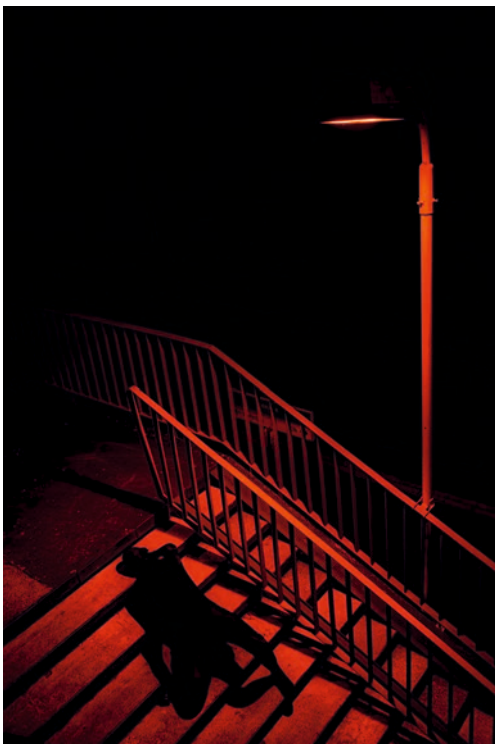
„Czerwona równoległość” Jakub Bogusz - Białystok 1 miejsce w grupie młodzieży

„Matematyka to nie tylko rachunki i wzory. To ważny składnik kultury człowieka, budowany przez wieki na fundamentach kultury antycznej. (...) Fotografia, czyli malowanie światłem, pomaga odczarować królową nauk. Utrwalone za pomocą aparatu fotograficznego reprezentacje abstrakcyjnych pojęć matematycznych odświeżają matematykę piękną, użyteczną i uniwersalną. Bliska na wyciągnięcie ręki.”