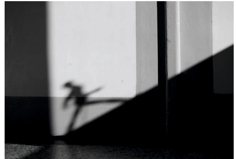
„Spacer Pitagorasa” - Paweł Latocha - Bogumiłowice 2 miejsce w grupie młodzieży