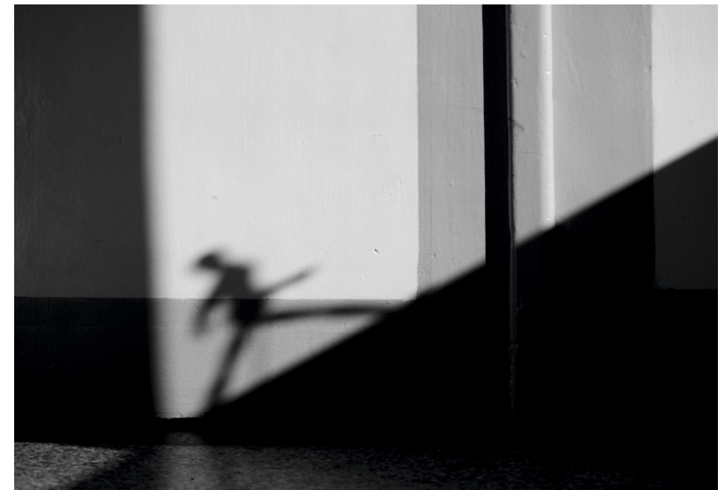
„Spacer Pitagorasa” - Paweł Latocha - Bogumiłowice 2 miejsce w grupie młodzieży