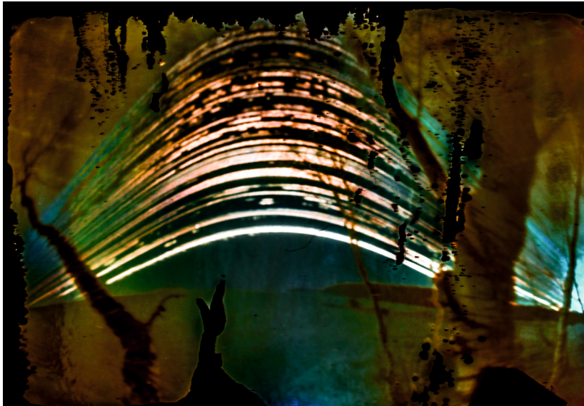
„Obraz linii Słońca” Sławomir Pietrzykowski - Jaksice wyróżnienie w grupie dorosłych