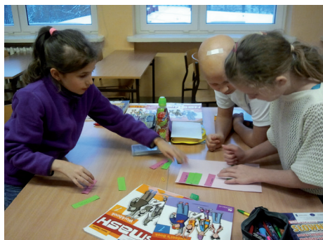
Nauka w grupach

twórczą, świadomość kulturalną i zdolności sportowe (koszykówka, szachy, tenis stołowy); z doradcą zawodowym w celu aktywizowania uczniów do podejmowania samodzielnych decyzji edukacyjno-zawodowych (dla uczniów klas VI).