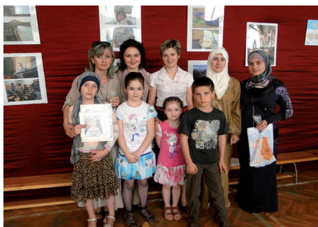
Podczas podsumowania konkursu