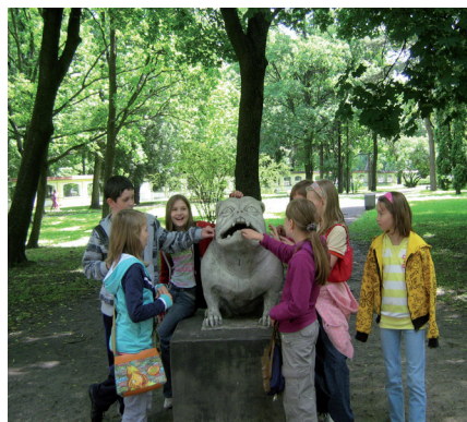
Poznanie dziedzictwa kulturowego Białegostoku