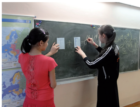
Aktywne zadania gwarantujące sukces

Działanie, ze względu na zastosowanie metody międzykulturowego portfolio, cieszyło się dużym zainteresowaniem dzieci. Cudzoziemcy z chęcią uczęszczali na zajęcia i z zaangażowaniem wykonywali zadania językowe i plastyczne. Po zakończeniu pilotażu projektu dostrzegłyśmy znaczny wzrost umiejętności komunikacyjnych dzieci oraz ich motywacji do nauki języka polskiego. Wskazywała na to także ewaluacja dokonana w ramach podsumowania zajęć. Obecnie działanie prowadzone jest na terenie polskich szkół, jak i innych placówek zajmujących się edukacją formalną i pozaformalną.