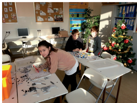
Praca nad projektem

W toku działania dostrzeżono, że do podwyższenia rezultatów uczenia się oraz efektywności pracy uczniów przyczyniła się niewątpliwie stosowana strategia pracy – kooperatywne uczenie się, które wymagało małej liczby dzieci w grupie oraz aktywnych metod. Prowadzący zajęcia, na podstawie autorskich programów i scenariuszy, poprzez wyzwalanie uzdolnień i możliwości tkwiących w uczestnikach projektu, także tych o specjalnych potrzebach edukacyjnych, stwarzali przestrzeń do osiągnięcia i doświadczania sukcesów. Ponieważ dobra szkoła wyrównuje szanse edukacyjne uczniów dzięki temu, że umacnia ich aktywność i samodzielność, stąd praca na zajęciach oparta była również na metodzie projektu. Stosowana strategia oraz metody pracy umożliwiały uczniom wspólną pracę nad różnymi zadaniami, wspieranie się i rozwijanie kompetencji kluczowych. Wzbudzało to w dzieciach potrzebę okazywania szacunku innym oraz potrzebę tolerancji dla odmiennych poglądów czy postaw.