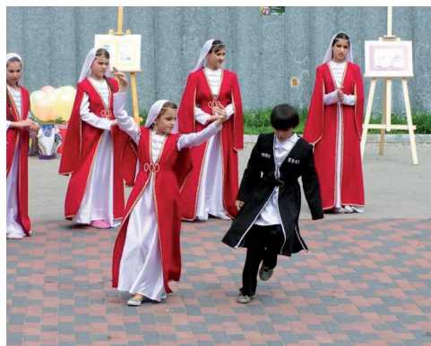
Obchody Światowego Dnia Uchodźcy

które obejmowały warsztaty tańca czeczeńskiego, warsztaty kulinarne oraz wycieczkę śladami dziedzictwa kulturowego Białegostoku.