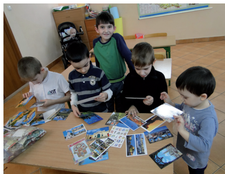
Tworzenie pocztówek z wakacji

z Ośrodkiem Pobytowym dla Cudzoziemców w Białymstoku. W trakcie zajęć szczególny akcent został położony na wybrane zagadnienia dotyczące polskiej kultury i realiów życia w Polsce. Bardzo ważne były również kwestie dotyczące innych kultur i rzeczywistości społecznych, ze szczególnym uwzględnieniem kultur pochodzenia uczestników zajęć. Należały do nich: sposoby witania się i normy grzecznościowe; święta i uroczystości rodzinne, religijne i narodowe; dom jako miejsce i przestrzeń najbliższa; rola i znaczenie szkoły w życiu dziecka; tradycyjne dania z różnych stron świata; różne aspekty podróży bliskich i dalekich; elementy historii lokalnej; symbole narodowe. Treści programowe były realizowane za pomocą aktywizujących metod pracy, które umożliwiły dzieciom korzystanie z ich potencjału twórczego oraz utwierdzały w przekonaniu, że są w stanie wiele osiągnąć w zakresie edukacji.