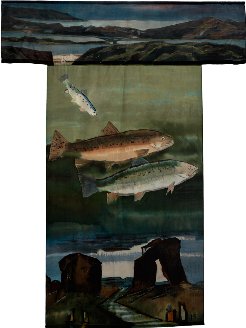
▲ Miasta ryb / Cities of Fishes , 2018, jedwab/ silk, 245 x 187 cm